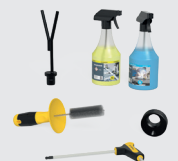
FOR FREE 1x 283999

Preisangaben in €, zzgl. MwSt, Verpackungs- und Transportkosten. Bei Selbstabholung berechnen wir bei Systemen 22 und 28 (Basic / Professional 750 / Professional Extreme 8.7 / Professional Extreme 8.8) Verpackungskosten in Höhe von 80 € bis 170 € und bei System 16 (Basic / Professional 750 / Professional Extreme 8.7) 55 € bis 170 €. Zahlbar 10 Tage rein netto, vorbehaltlich Bonitätsprüfung. Mindestbestellwert 50 €. Technische Änderungen vorbehalten. Ab Lager Oberrotmarshausen. Weiterverkauf vorbehalten. Es gelten unsere allgemeinen Geschäftsbedingungen. Preisänderungen und Druckfehler vorbehalten.